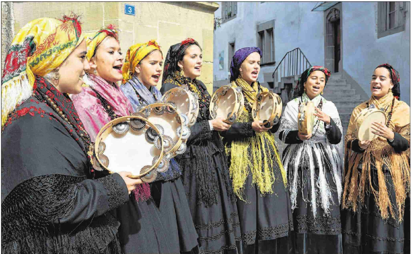
Les Galiciens – ici des joueuses de tambourin – ont proposé une première démonstration en Basse-Ville de Fribourg. CHARLES ELLENA THIBAUD GUIBAN

FESTIVAL • Les cultures celtiques tiennent la vedette des Rencontres de folklore. Les Colombiens, eux, ont dû être remplacés à la dernière minute.