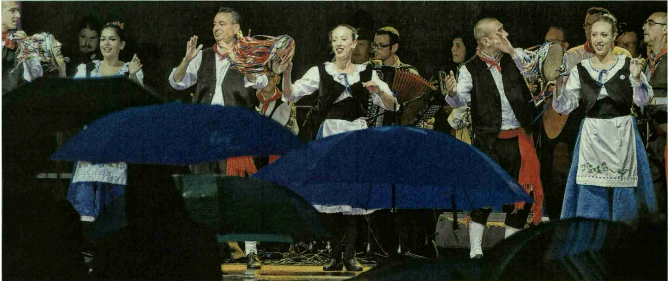
Die Gruppe A Lanterna aus Sizilien trotzte am Samstagabend mit ihrer energiegeladenen Darbietung dem Regen.

Trotz eines verregneten Abschlussabends war das 42. Internationale Folkloretreffen Freiburg , das gestern Nachmittag zu Ende ging, ein Erfolg: Rund 30 000 Besucherinnen und Besucher liessen sich während einer Woche von neun Folkloregruppen aus aller Welt verzaubern.