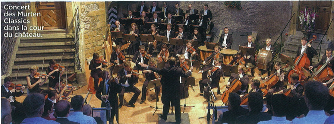
Concert des Murten Classics dans la cour du château.